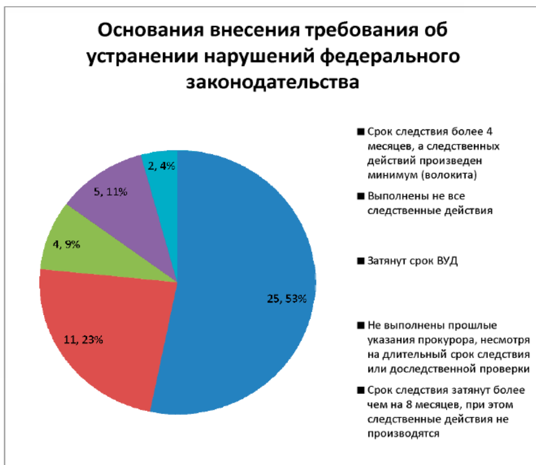
Рисунок А.1 – Основания внесения требования об устранении нарушений федерального законодательства

Среди наиболее распространенных причин, в связи с которыми выносились требования следователям СК РФ, следующие: