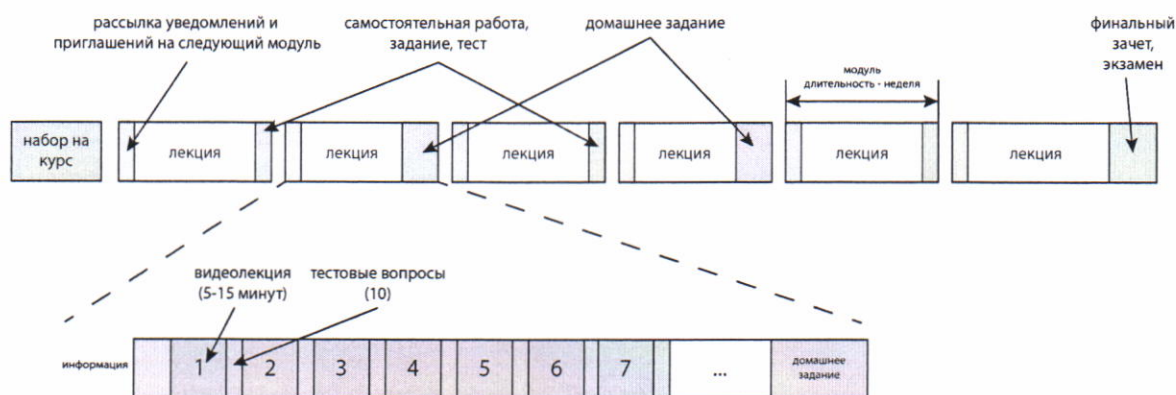
Рис.1. Примерная структура курса и модуля

Объем и параметры открытых онлайн-курсов определяются разработанной на факультете образовательной программой (высшего или дополнительного профессионального образования, либо дополнительного образования детей и/или взрослых). Рекомендованная длительность курса составляет 2-3 недели (для программ дополнительного образования) и 6-9 недель (для программ высшего или дополнительного профессионального образования) при режиме занятий 8-12 академических часов в неделю, в зависимости от сложности модуля и курса. Структурной единицей курса является модуль. Количество модулей курса от 3 до 10. Длительность модуля составляет 1 неделю. Последний модуль является итоговым для проведения экзамена или зачета и подведения итогов обучения. Примерная структура курса и модуля представлена на рисунке 1.