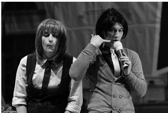
Стэм про клубных девушек.

Учитывая, что ребята только начинали, то они еще не умели придумывать такие шутки, на счет которых с уверенностью бы знали, что они будут интересны зрителям, просто играли в свое удовольствие. Первые два года были развивающими: не было ни особых успехов, ни наград. А вот уже третий год, это был сезон 2009 года, ознаменовался долгожданными победами и достижениями в области творческой деятельности. Ребята дважды принимали участие в международном фестивале в городе Сочи, выиграли кубок ТГАСУ, кубок профкома, открытую лигу