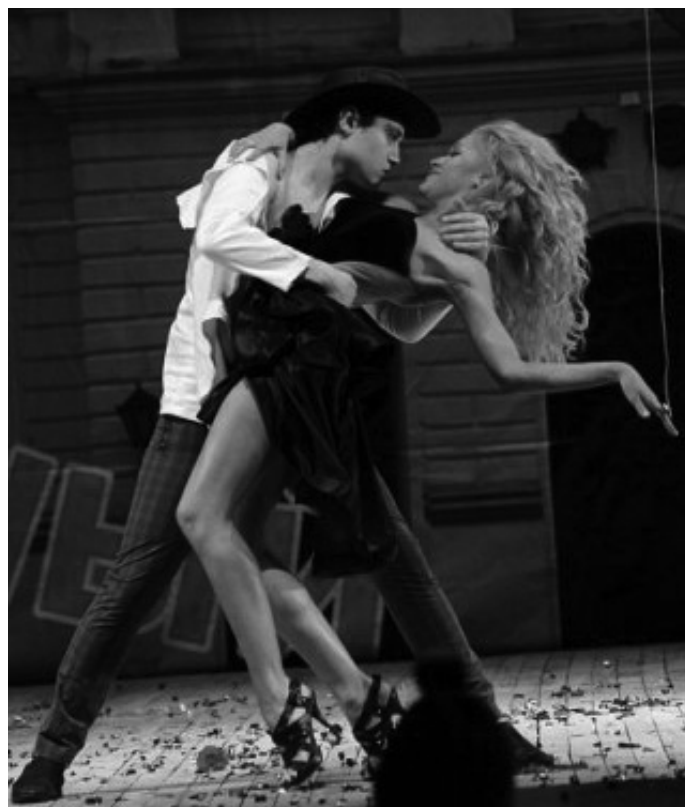
Музыкальный номер, финал.

После первой сыгранной игры в сезоне 2007 года, зрители приняли новую команду на ура, тогда и было принято решение, что будут продолжать дальше играть, развиваться и идти к исполнению мечты.