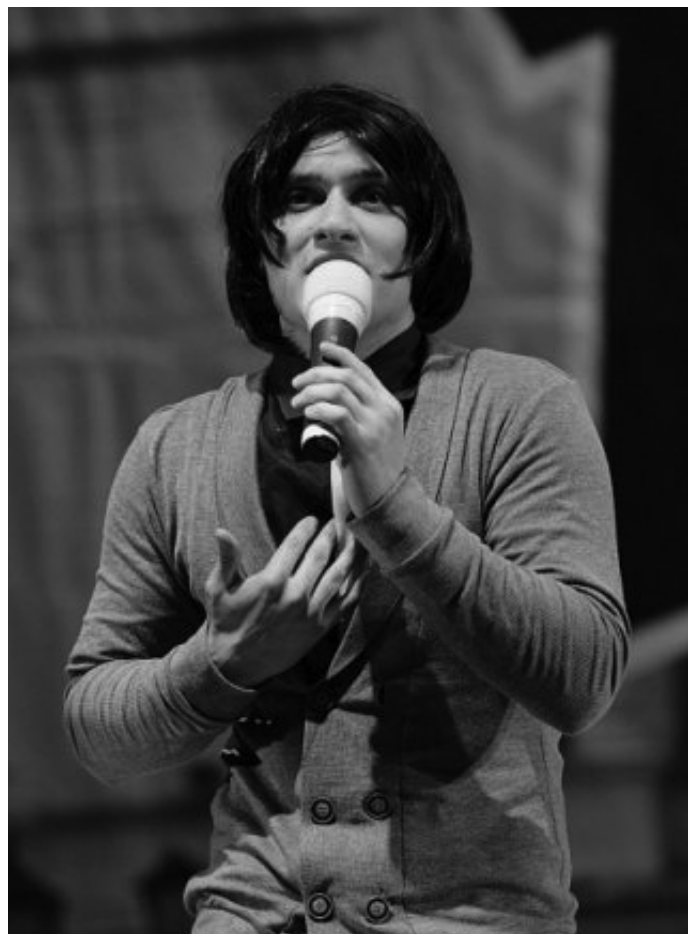
Стем. Одна из клубных девушек.

бросили на это все силы, физические, умственные и финансовые.