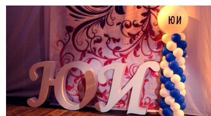
Кафедры — юбиляры стр.8-11