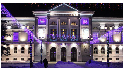
Календарь на 2014 год! стр. 6-7