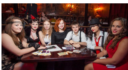
Почему люди выбирают ЮИ? стр.4-5