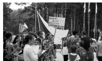
День выборов в ДОЛ «Солнечный»

Для того чтобы ребята имели представления о том, как проходят выборы, в ДОЛ «Солнечный» в игровой форме была проведена модель «День выборов», по итогам которой был избран президент лагеря. В ходе поездок в иные ДОЛ проводилось кругосветное путешествие «Я — Гражданин России», интересное и увлекательное. Самые активные участники были отмечены памятными подарками от Избирательной комиссии