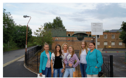
Путешествие на Альбион стр. 11