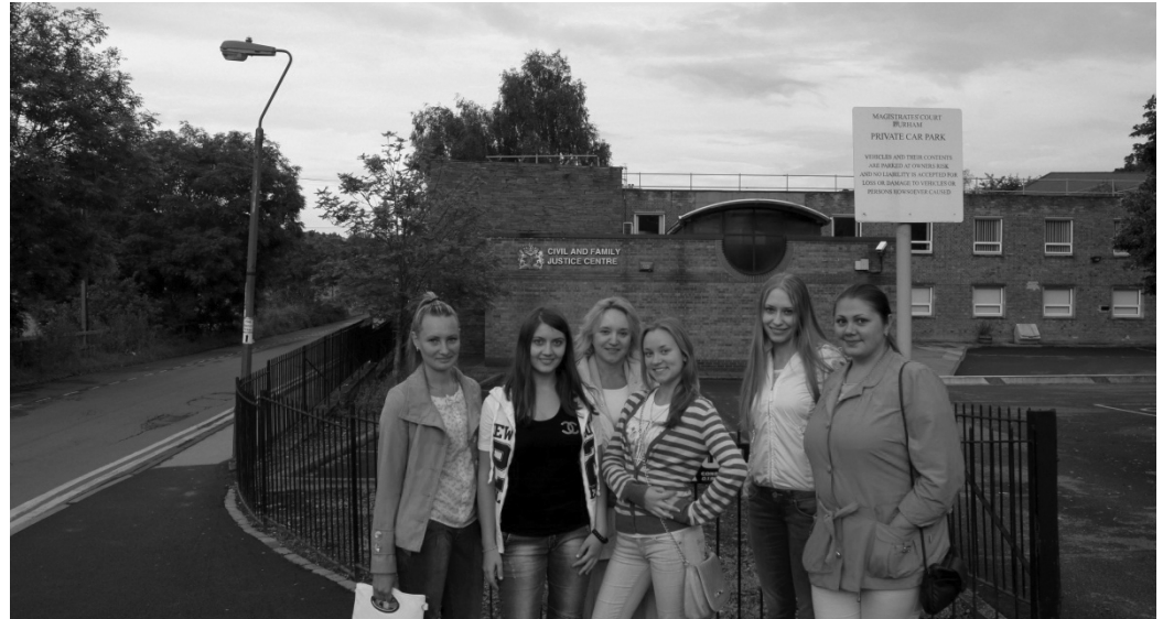
У здания суда по гражданским делам в Дарэме

Запомнилась экскурсия в Бимиш, музей под открытым небом, занимающий огромную территорию — живой музей. Здесь люди одеты в одежды XIX века, сладости и хлеб, которые