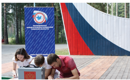
Молодым везде у нас дорога! стр.7