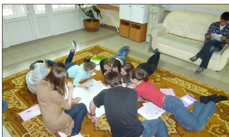
Иновации и бизнес стр. 10