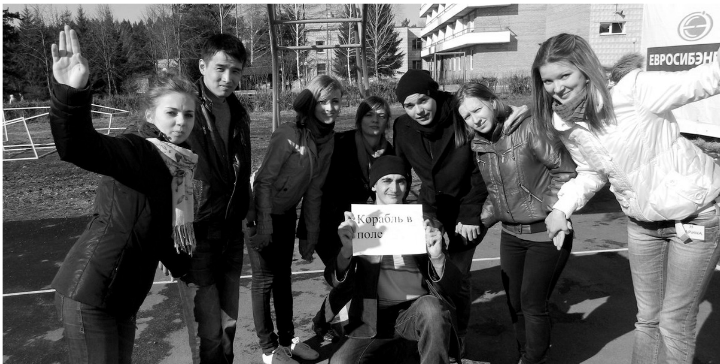
Участники молодежного проекта «InnoTeam», 7 апреля 2012г

В рамках молодежного проекта «InnoTeam» 7–8 апреля 2012 г. отделом коммерциализации результатов НИОКР ТГУ проводился второй этап отборочного тура для желающих пройти обучение в области ведения высокотехнологичного бизнеса в инновационной сфере. Повезло принять участие в этом мероприятии и мне!