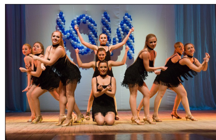
Justify Dance стр.11