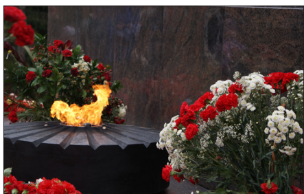
Но всё ли мы помним? стр.3

Пусть нам улыбнется удача! Ни пуха ни пера!