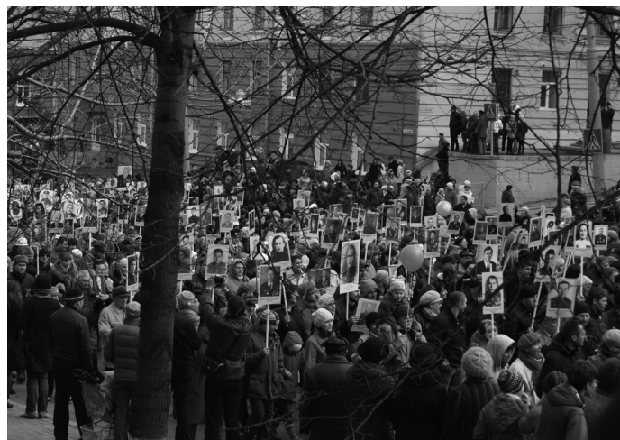
Акция «Бессмертный полк» Тысячи жителей Томска прошли колонной по улицам города с портретами своих близких, участвовавших в войне.