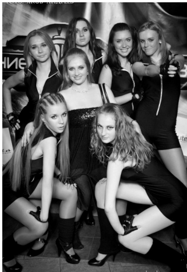
«Justify Dance», посвящение ЮИ «Земля 23:10», 2010г.

Примечательно, что коллектив образовался совершенно стихийно, по инициативе студенток с разных курсов. Со временем, конечно, происходили изменения, но в целом состав кардинально не изменился. Новичков всег-