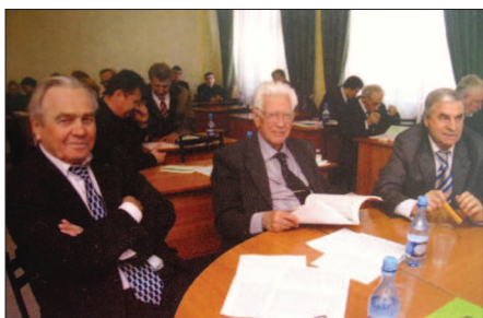
С кого все начиналось? стр.4-5