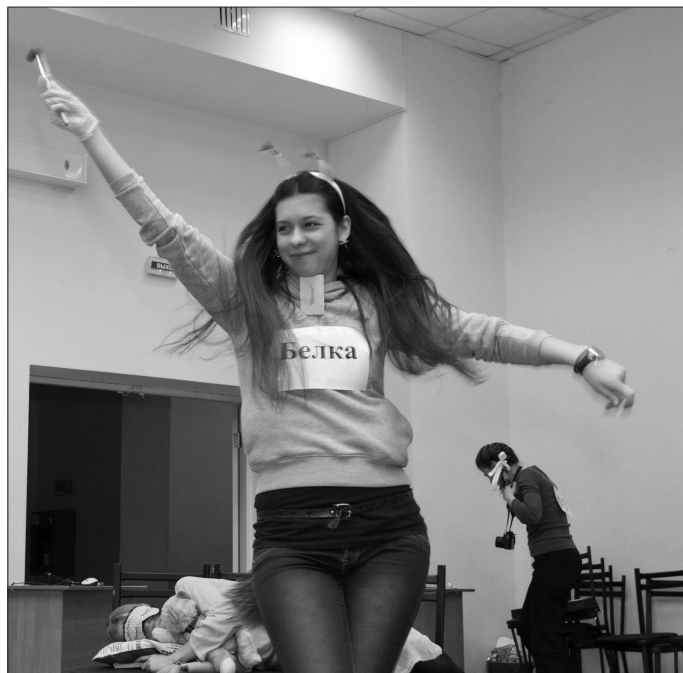
Визитка победителей турнира команды «Видок». Зал взрывался от смеха!

несколько непривычно оценивать ребят, с которыми я недавно ходила в университет. Хотелось им помочь,